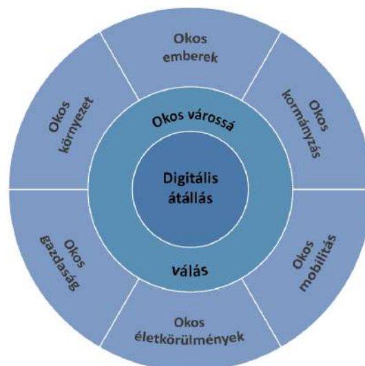
X.6-9. ábra A digitális átállás célrendszere

Az okos gazdaság alappillére, a versenyképesség meghatározó szempontja a technológiai fejlődéshez történő folyamatos alkalmazkodás.