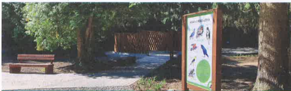
A 2020-ban átadott Eresztvényi Madárpark sok kiránduló tetszését nyerte már el