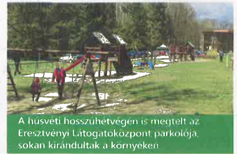
A húsvéti hosszuhétvégén is megtelt az Eresztvényi Látogatóközpont parkolója, sokan kirándultak a környéken

Az eddigi és a jövőbeni fejlesztések is ennek a pozíciónak a megtartását erősítik: