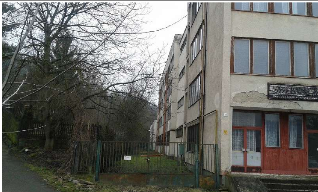
Fotó 2018. 01. északi oldal felől