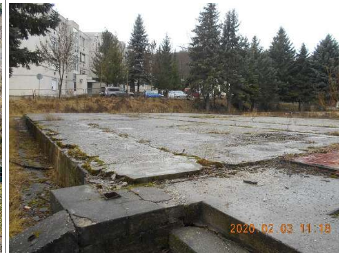
Fotó észak felől 2020. 02. 03.