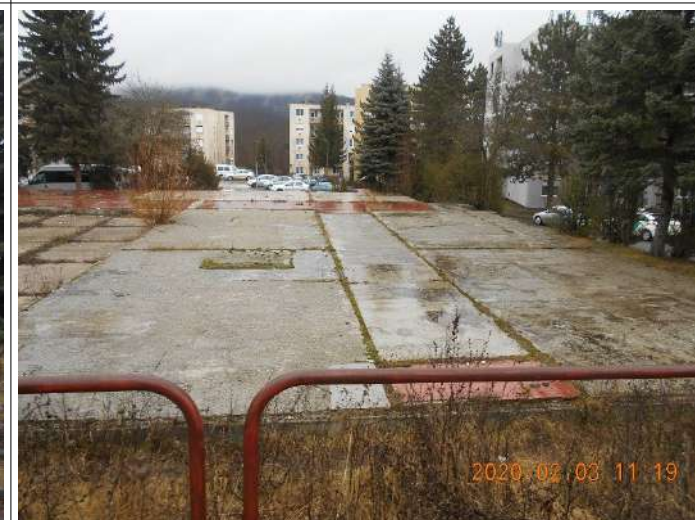
Fotó dél felől 2020. 02. 03. a buszmegálló korlátjával