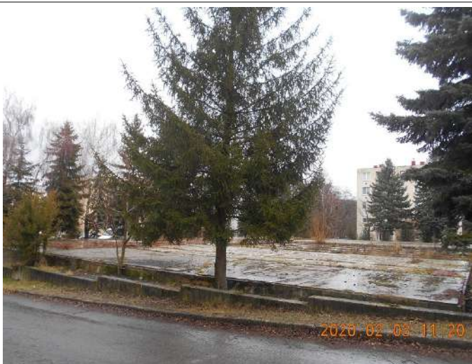
Fotó nyugat felől 2020. 02. 03.