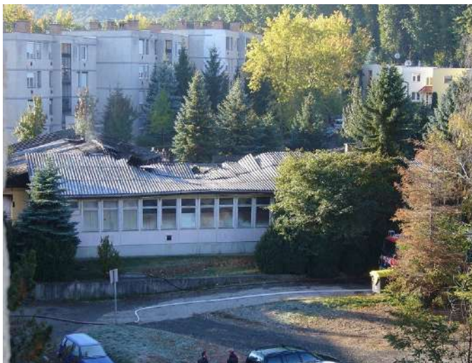
Fotó észak felől a tűz másnapján 2011. 10. 15.