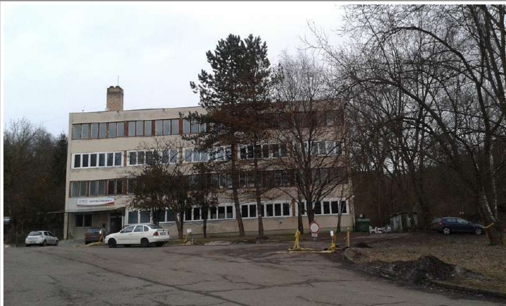
Fotó 2020. 02. irodaépület