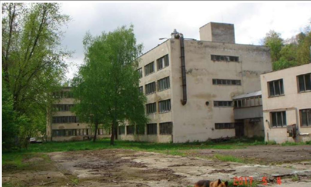
Fotó 2017. 05. Belső udvar felől