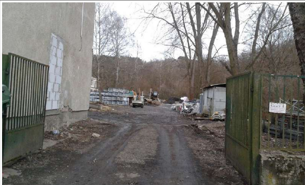
Fotó 2020. 02. udvar bejárat felől